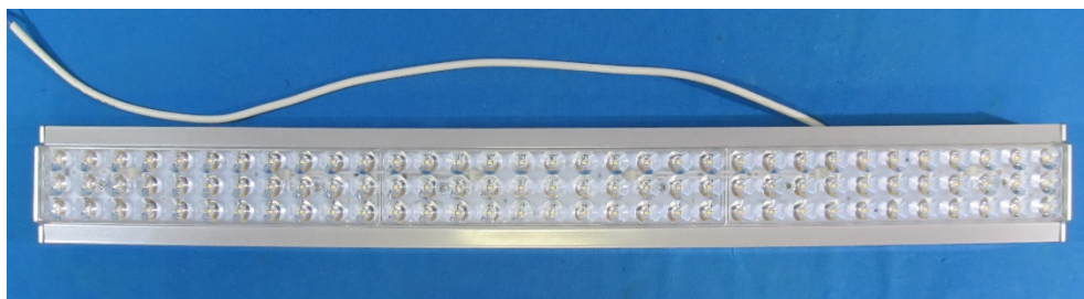
Светодиодный светильник VOLGA/38/110 (Общий вид)