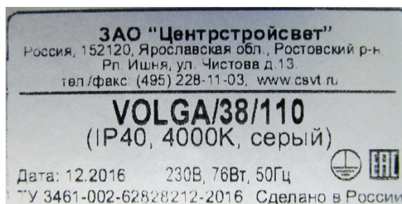
Светодиодный светильник VOLGA/38/110 (Маркировка)