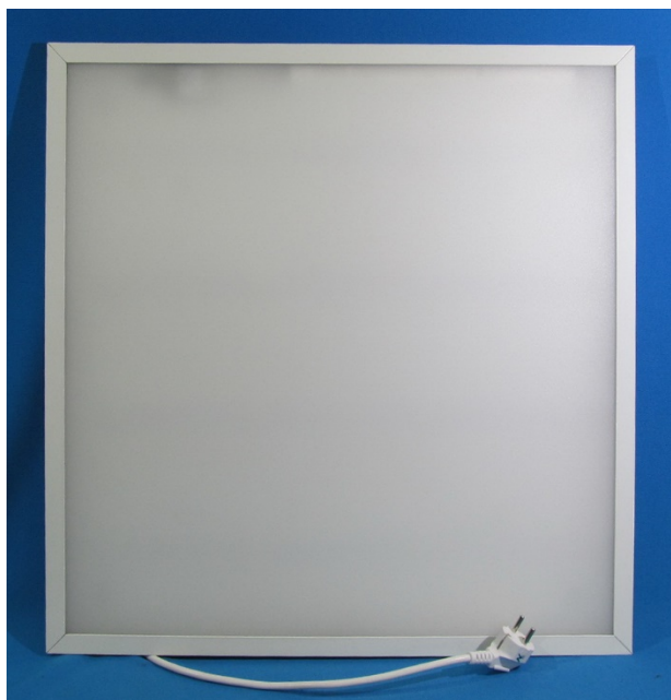
Светильник AVRORA-32/Opal-Sand (Общий вид)