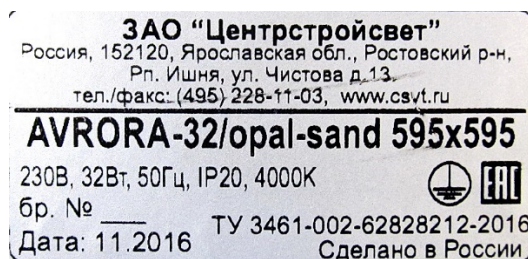
Светильник AVRORA-32/Opal-Sand (Маркировка)