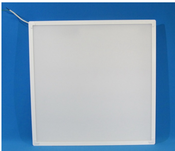
Светодиодный светильник ALIMOGIPS -38/opal sand 595x595 (IP40, 4000 К, белый) (Общий вид)